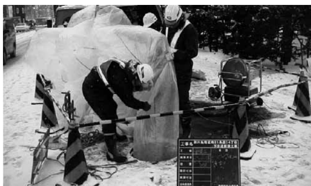
インナーフィルム除去工